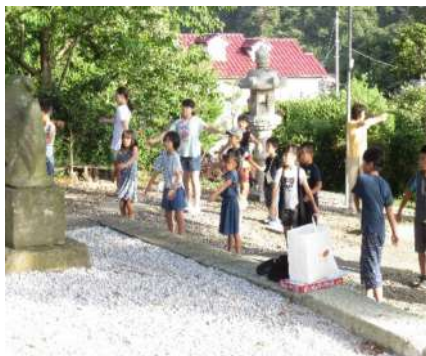
御滝神社境内の様子

町内恒例行事「朝のラジオ体操ライブ」が子ども会主催で、8月20日（月）24日（金）（金曜日は台風の影響で中止）御滝神社境内及び等覚寺において、小学生児童を中心に、町内高齢者が加わり1日平均で約40人が参加した。